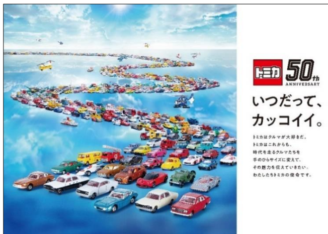
「トミカ」50周年 キービジュアル

50周年のキーメッセージは、「いつだって、カッコイイ。」です。いつの時代も色あせない「トミカ」がもつ「カッコよさ」を、「トミカ」で遊んでくださったすべての方に感謝の気持ちとともに発信してまいります。50周年となる今年は、ユーザー参加型イベントの実施、記念商品の発売、アニメ化にとまなうメディアミックス、様々な他業種とのコラボレーションなどを展開し、ますます「トミカ」を盛り上げていきます。