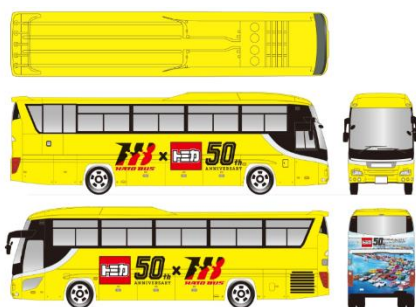
「リアルトミカ号」デザインイメージ