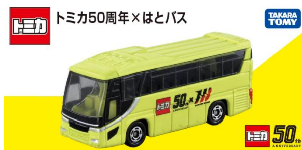
オリジナルの「トミカ」画像