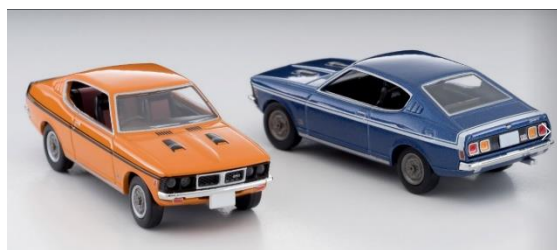
ギャランGTO MR 商品画像

商品名：「トミカリミテッド ヴィンテージ ネオ LV-N205a 日産セドリック2000GL(茶)」 「トミカリミテッド ヴィンテージ ネオ LV-N205b 日産セドリック2000GL(黒)」 「トミカリミテッド ヴィンテージ ネオ LV-N204a 三菱コルト ギャランGTO MR(橙)」 「トミカリミテッド ヴィンテージ ネオ LV-N204b 三菱ギャランGTO MR(青)」