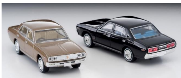
セドリック2000GL 商品画像

1972年当時に発売した「トミカ」での商品名は「トミカNo. 30 コルト ギャランGTO」です。当時の製品の箱絵に描かれていたオレンジ色のMRを再現します。オレンジ色は実車初期の1970年式、青は1972年式を再現しており、車名と細部の彩色がそれぞれ異なります。