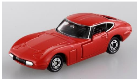
商品画像 (Vol.1 トヨタ 2000GT)